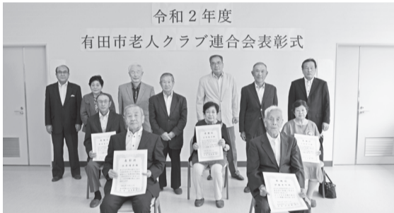
令和2年度 有田市老人クラブ連合会表彰式