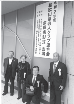
令和2年度 和歌山県老人クラブ連合会 会長表彰式会場